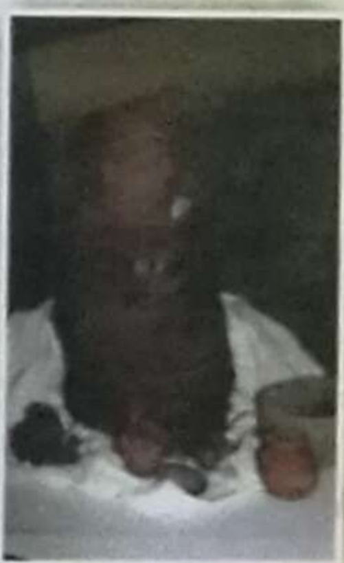
Momía en un fardo de sogas, corresponde a una mujer, en el pecho lleva un nuki, que es una herramienta para tejer.

Conopa que corresponde a una alpaca trabajada en piedra de basalto negra, de uso ceremonial como illa para la reproducción de camélidos.