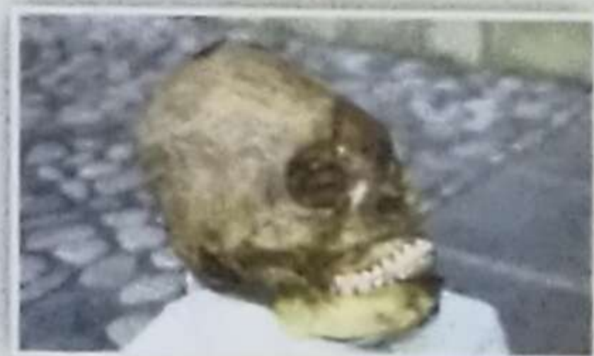
Cráneo de mujer con una trepanación en la parte posterior del cráneo