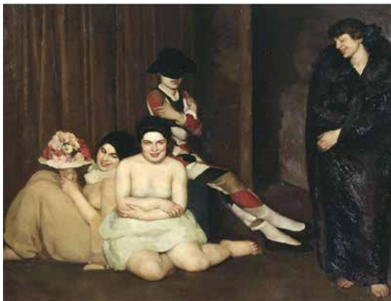
Maschere / Máscaras , Emilio Maserba (1922), Galleria nazionale d'arte moderna, Roma

Con harta notoriedad, Maschere causa conmoción. Pero más allá de lo escandaloso que puede resultar esta pintura, notemos que Maserba aplica las reglas del Primo Rinascimento ; o sea, sublimar las carnes de tono alabastro con unas atmósferas casi surreales que se encuentran en el realismo mágico de la pintura de Paolo Uccello. Aquí, los personajes de este cuadro parecen cansados, y hasta Arlequín se abandona, lejos de la agitación habitual del carnaval.