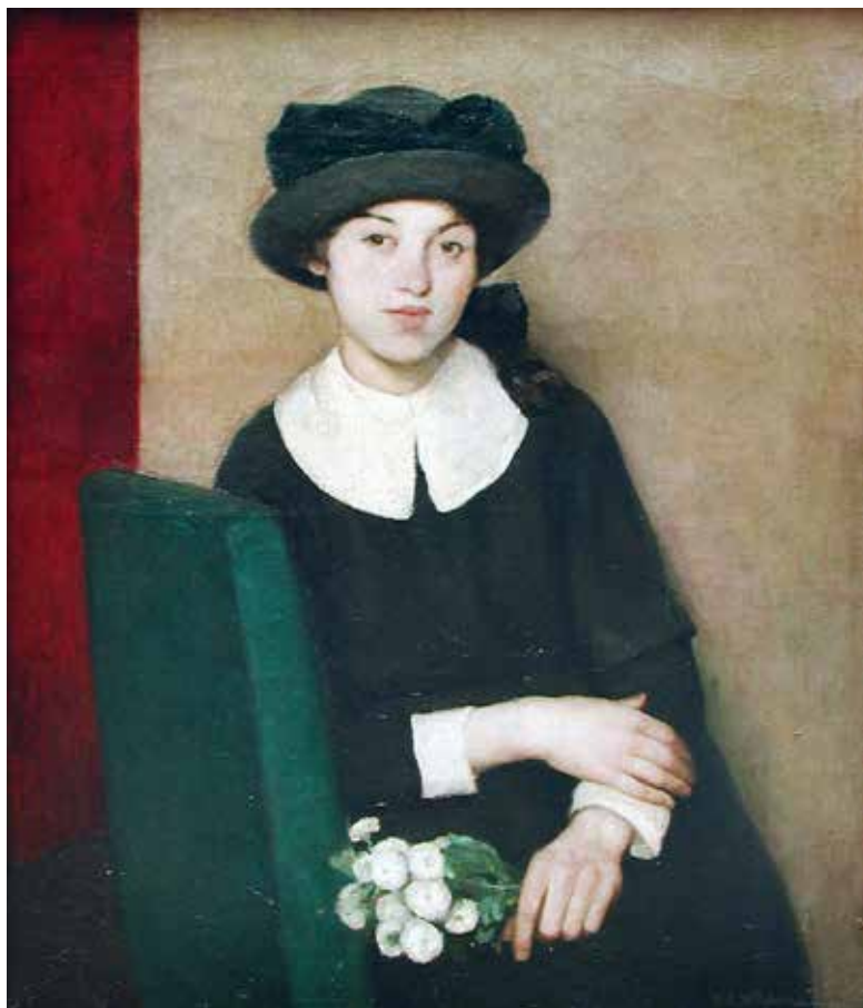
Gian Emilio Malerba, La colegiala , óleo sobre lienzo, 73 x 62 cm