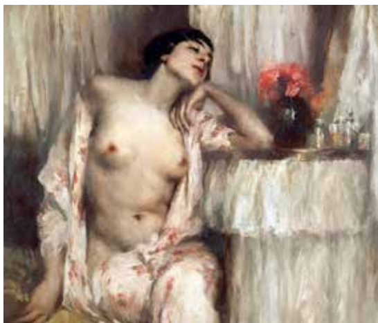
Donna alla toilette / Mujer en el baño (1913), óleo sobre lienzo