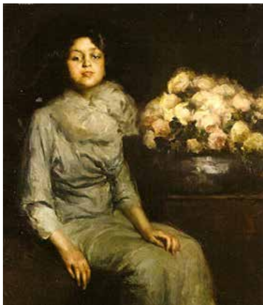
Il cappello nero / El sombrero negro (1912), óleo sobre lienzo, 107 x 92,3 cm, Palazzo del Quirinale Roma