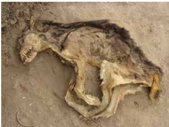
Hallazgo de perro en la Pirámide con rampa 7