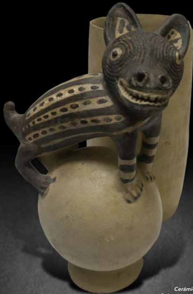
▲ Cerámica estilo Chancay Colección Museo de la Nación