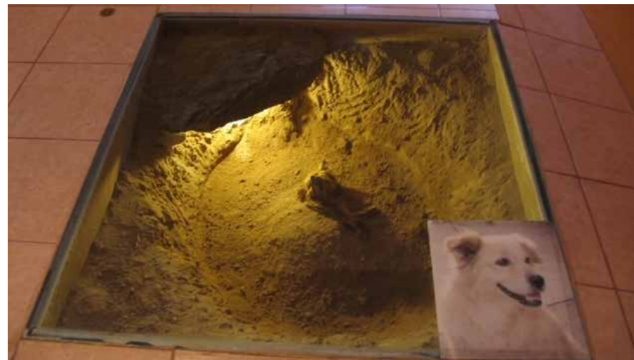
▲ Entierro de perro pastor Chiribaya

Como parte del ritual funerario, estos animales fueron envueltos con telas y se les colocaron ofrendas como comida, pescado y spondyllus , inhumándolos en un área especial destinada solo para ello, es decir un cementerio de perros.