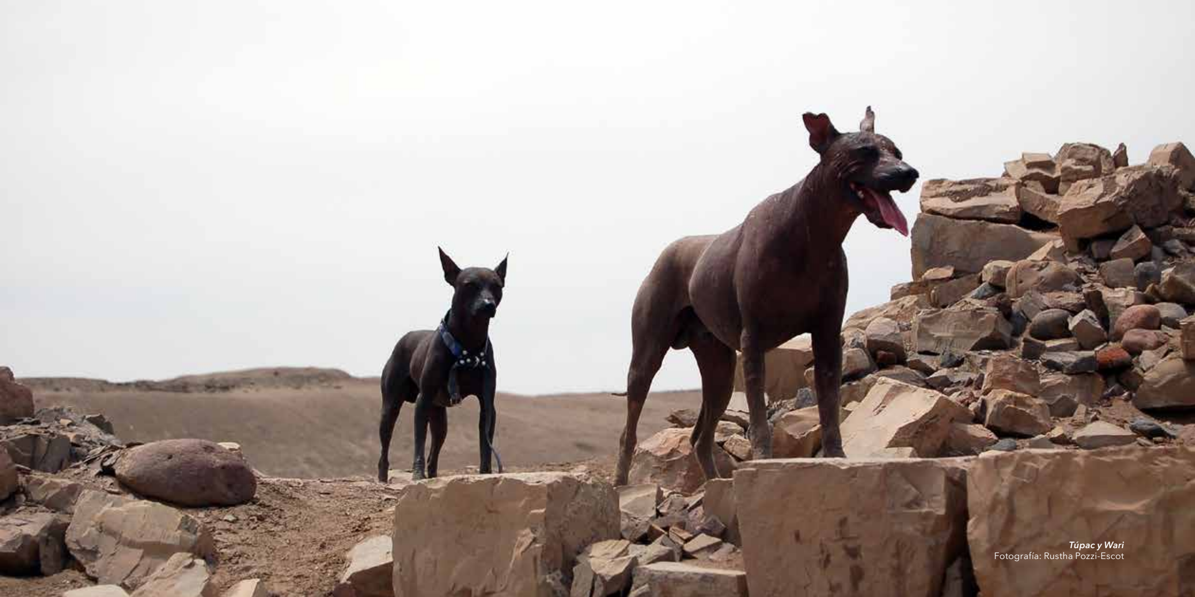
Túpac y Wari