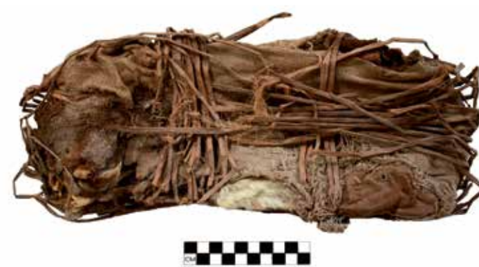
Fardo de perro hallado en la Segunda muralla.

colocación en la etapa final del ritual funerario de los humanos (Eeckhout, 2004; Pozzi Escot et al. 2012a; Cornejo, I. et al., 2012). Tal vez esta forma se relacionaría con la creencia de la cosmovisión andina que hace referencia a que los perros serían un ser psicopompo, tal como lo estaría reflejando la presencia del perro en la iconografía Moche según Benson (citado por Eeckhout, 2004). Psicopompo es un ser que actúa como guía, conduciendo y ayudando al difunto desde el mundo de los vivos hacia el mundo de los muertos (Venegas, K., 2019). Asimismo, también se inhumaron perros en el santuario como parte de las ofrendas colocadas durante el proceso constructivo (Cornejo, I. et al., 2012).