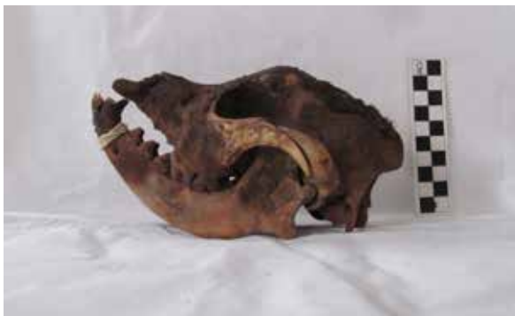
Cráneo de perro prehispánico de Pachacamac