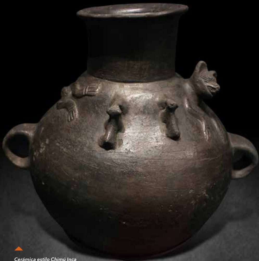
▲ Cerámica estilo Chimú Inca Colección Museo Pachacamac