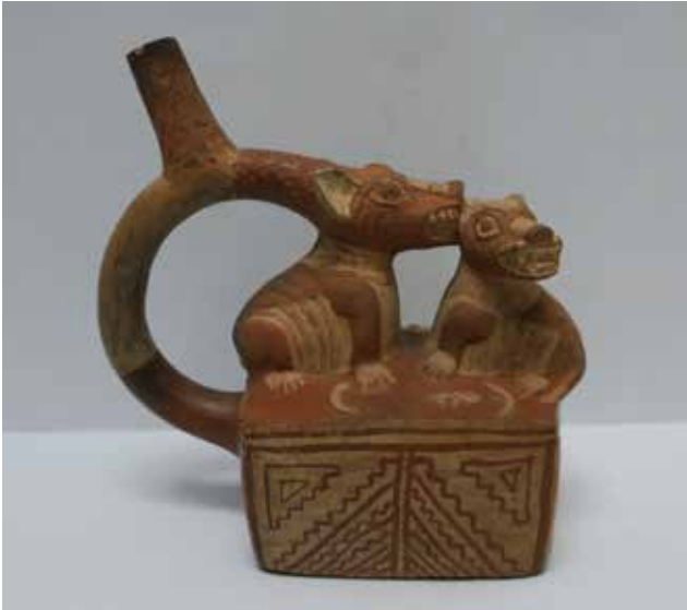
◀ Cerámica estilo Moche Colección Museo de la Nación

Fuera de Pachacamac, otros contextos revelan otras funciones de los perros, como por ejemplo haber sido parte del consumo humano. Las evidencias de ello no son muy abundantes, no obstante excavaciones en el valle del Mantaro demuestran que, si bien la carne de perro no tuvo tanta preferencia como la del camélido y cérvido, también fue consumida por el señorío Wanka antes y durante el dominio Inca (Costin, C., y Earle, T., 1989).