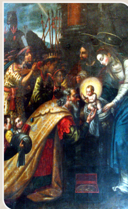
Adoración de los Reyes Magos