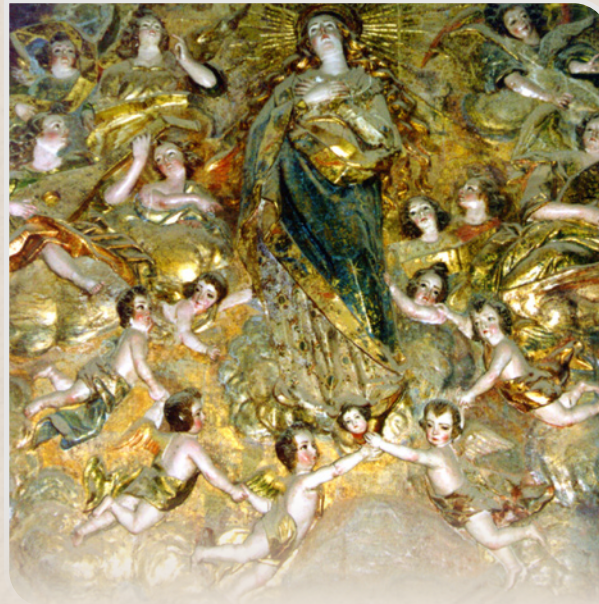
Asunción de la Virgen (relieve)

También debemos destacar la inscripción que existe en la puerta de la sacristía "NOM ESCALIVD NISI DOMVS DEI ET PORTA CUELIS" que significa "creo que no hay otra cosa que la casa de Dios y la puerta del cielo".