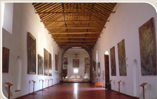
Interior del Museo

En la Provincia de Chucuito, Distrito de Juli a dos cuadras de la plaza principal se ubica el Templo Museo Nuestra Señora de la Asunción de Juli, que impresiona con su imponente arco de ingreso construido de piedra labrada en la que se impone la sobriedad dórica y fineza de las líneas que realizan los medallones compuestas con el nomograma de la compañía de Jesús (JHS), también se erige la torre del Templo edificada con piedra labrada y la estructura de la nave principal construida de adobe, en este Templo se evidencia claramente la presencia de dos misiones religiosas por que la estructura de la nave fue construida en los años 1568 - 1576 por la orden de los Dominicos, posteriormente la torre y el arco fue construida por los Jesuitas en el año 1620. El Templo a lo largo de la historia a sufrido continuas intervenciones de conservación a causa de daños graves.