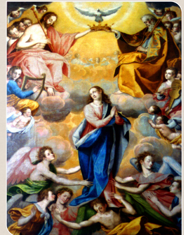
Coronación de la Virgen por la Santísima Trinidad Autori Bernardo Bitti Técnica/Material: Oleo/Lienzo Época: S-XVI / Estilo: Manierista