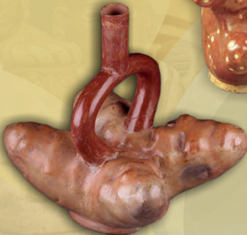
Botella Mochica (1-800 d.C) Museo Larco