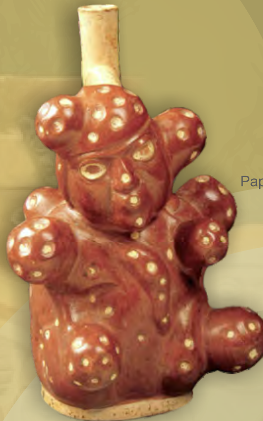
Papa antropomorfa Mochica (400 d.C) Museo Larco