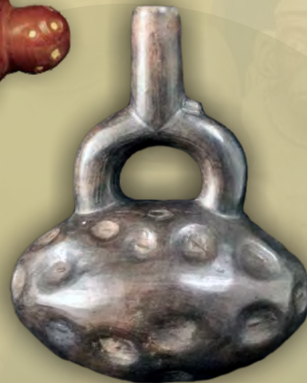
Representación de la papa Colección privada Galimberti