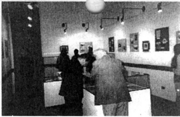
Sala de Exposición