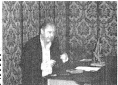
Dr. Alfredo Barnechea Conferencia "La Escena Contemporánea Actual" 15 Noviembre 2005

Esperamos contar con ustedes para el próximo año. Feliz Navidad y un mejor Año Nuevo 2006.