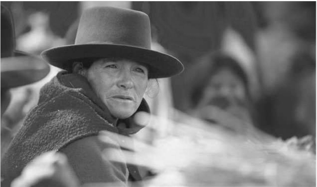
Población Andina. Según Mariátegui, la cuestión indígena tenía sus raíces en el régimen de propiedad de la tierra.

La sensibilidad de Mariátegui le hizo ver un Perú desarticulado que buscaba, y aún lo hace, encontrarse con pueblos, aldeas, comunidades, villorrios, en un mismo destino para afianzarse en una historia común, cotidiana, real y posible.