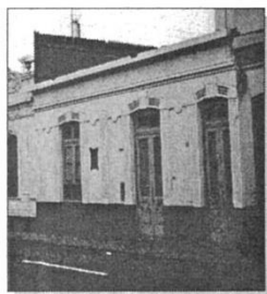
CASA MUSEO JOSE CARLOS MARIATEGUI