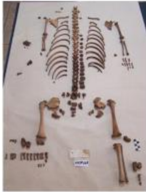
Los esqueletos deben fotografiarse en posición anatómica.

A continuación las vistas fotográficas a considerar: