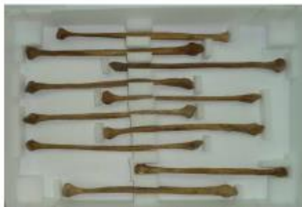
El material óseo puede tener alternativas en la preparación de las cajas con el fin de garantizar su estabilidad