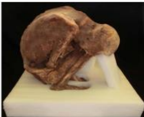
Cada bien requiere un soporte que se amolde a sus características y naturaleza.