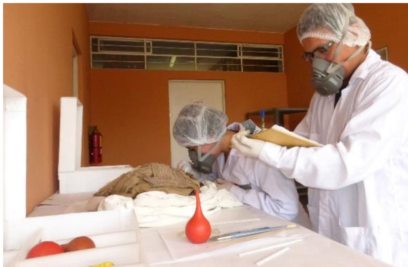
Las labores de registro deben realizarse con el vestuario y elementos de protección necesarios

Es recomendable que se realice el inventario 4 como primer paso para la identificación de los bienes culturales muebles. Todos los bienes deben ser identificados mediante un código que el museo asigne a los integrantes de su acervo. Este código es irrepitible, consecutivo y correlativo que servirá para proteger el material identificándolo como único. Posteriormente, según la valoración realizada se procederá a su inscripción, declaratoria y registro.