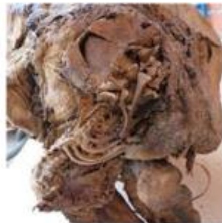
Otros elementos llamativos