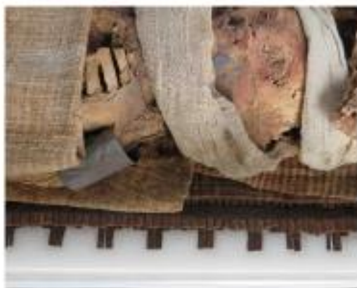
Se debe tener en cuenta los materiales que componen el bien al momento de preparar las planchas de espuma de polietileno