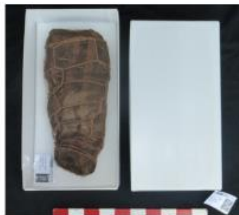
Papel seda blanco puede servir de protección a los bienes que se encuentran embalados