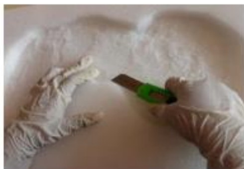
Calado de las bandejas en espuma de polietileno