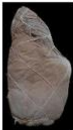
Vista lateral derecha