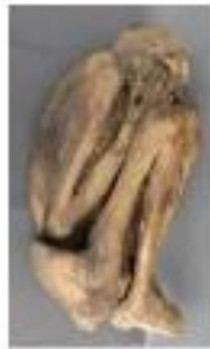
Vista lateral derecha