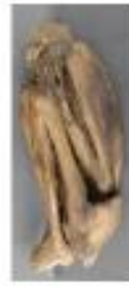
Vista lateral izquierda