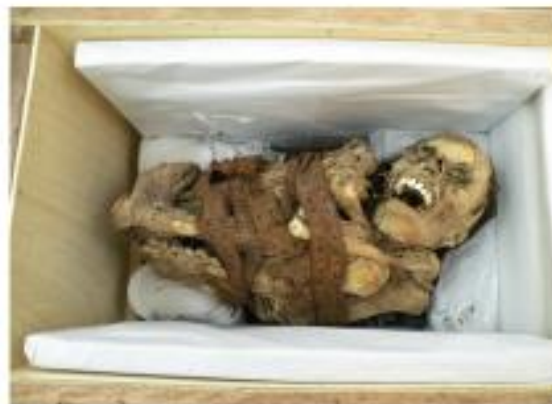
Las planchas también servirán para evitar el movimiento del bien dentro de la caja