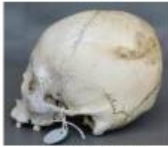
Vista lateral izquierda