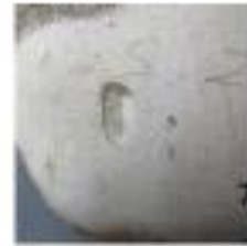
Vista de detalle (trauma)

En caso de cráneos, cabezas, momias y fardos, idealmente se deben hacer tomas en las vistas anterior, posterior, lateral derecha, lateral izquierda, superior e inferior. Si existe algún rasgo/patología de interés, se debe fotografiar en una toma de detalle.