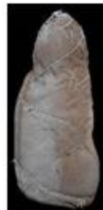
Vista lateral izquierda