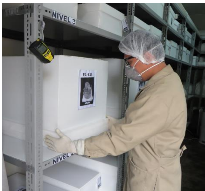
Indumentaria necesaria para manipular restos animales y humanos.

El embalaje apropiado y el depósito debidamente acondicionado, permiten la conservación y mantener la integridad de los bienes culturales. Es por eso que los bienes deben ser embalados en contenedores hechos con materiales libres de ácido y acordes a su forma y tamaño, para evitar la inestabilidad o el roce entre ellos o con otros elementos.