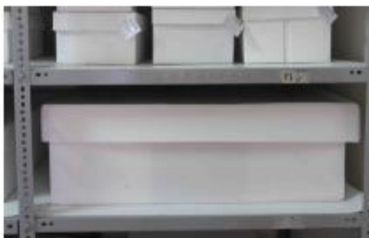
Disposición de las cajas en donde se depositan estos bienes