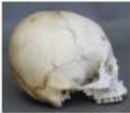
Vista lateral derecha