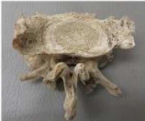
Forma anormal del hueso